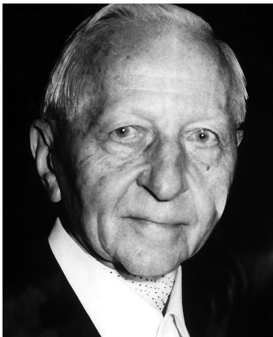
Bernhard Häring, C.Ss.R. (1912-1998)

“Credo che Bernhard Häring sia stato il primo che ha cominciato a cercare una nuova via per far rifiorire la Teologia morale”